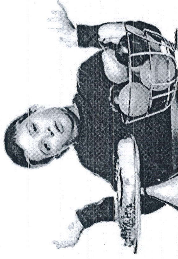
Сахарный диабет у ребенка